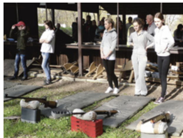
Drużyna wągrowczanek na strzelnicy zaprezentowała się niezwykle... urocz.

Był to debiut naszej reprezentacji w tego typu zawodach. Dziewczęta sprawiły się