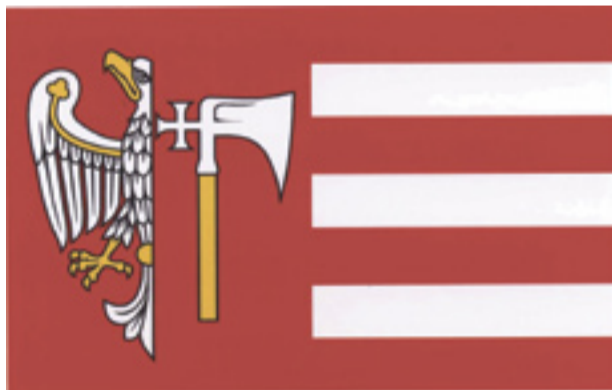
Nowy herb i flaga powiatu wągrowieckiego.