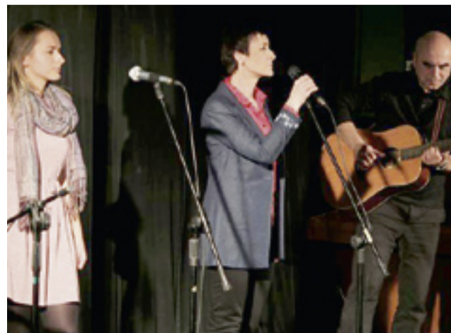
Artyści na scenie.

Jubileuszowe XV Spotkania z piosenką literacką „Śpiewy na łodziach” już za nami.