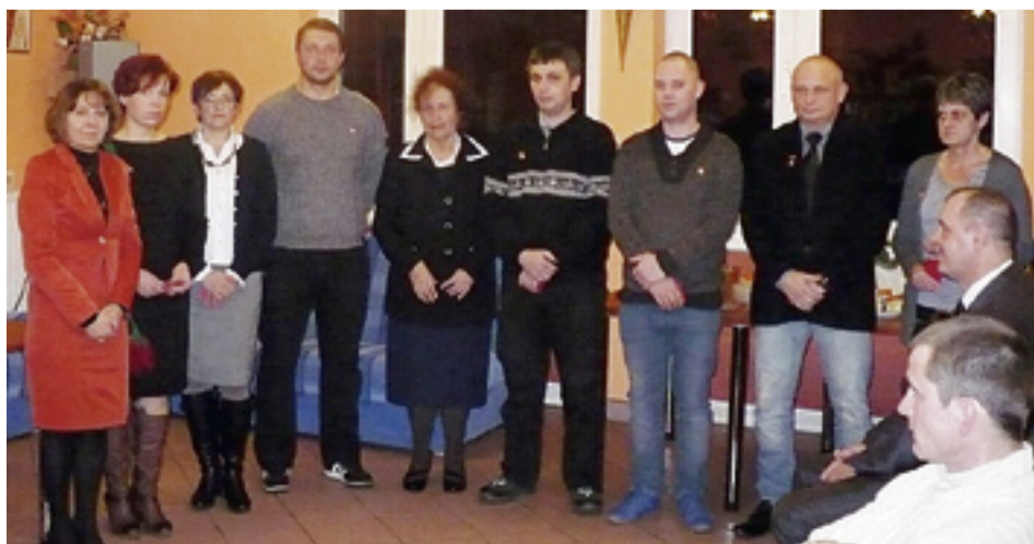
Nagrodzeni i goście uroczystości.

Obchody zorganizowane przez Polski Czerwony Krzyż w Wągrowcu 1 grudnia br. były okazją do uhonorowania najbardziej zaangażowanych dawców krwi i propagatorów krwiodawstwa.