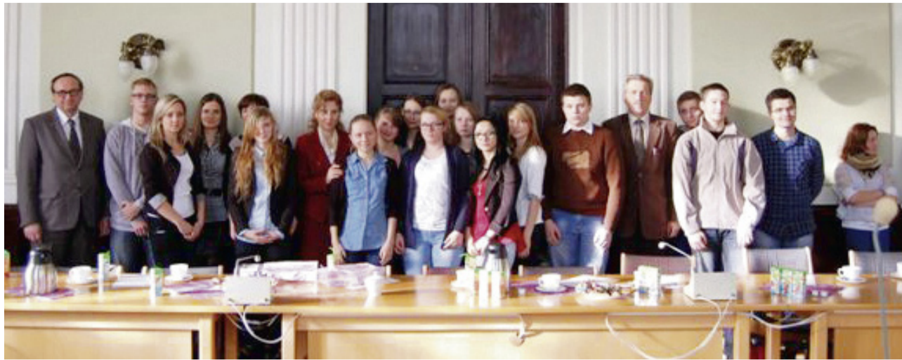
Laureaci i uczestnicy w starostwie.

Konkurs skierowany był do młodzieży szkół gimnazjalnych, a zadanie konkursowe polegało na zaprojektowaniu