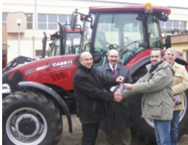
Moment przekazania kluczyków do ciągnika.

Wśród najważniejszych obowiązków, do których zobligowane zostały firmy