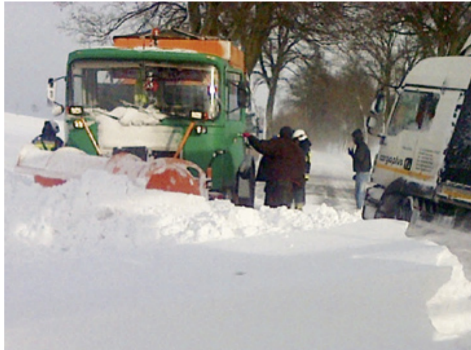
Zima to najtrudniejszy czas dla drogowców.

Rozszerzenie zakresu prac zimowego utrzymania dróg na tych drogach może nastąpić wg decyzji Urzędów Gmin na ich własny koszt. Prace przy zimowym utrzymaniu