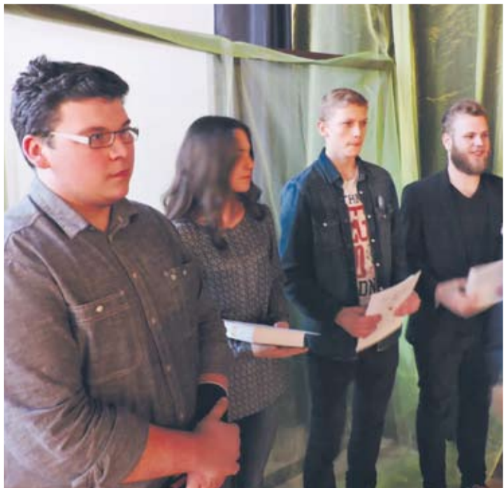
Laureaci ze szkół ponadgimnazjalnych.

- Doczekaliśmy 10. edycji Powiatowego Konkursu Wokalistów „Graj Muzyka”, który od początku organizuje Ognisko Pracy Pomaszkołnej. Jubileusz skłania do refleksji - myślę pozytywnych, bo udało się zachować ciągłość przedsięwzięcia, a z przeszło pół tysiąca osób, które przewinęły się w tym czasie przez scenę, wyrosło pokolenie świetnych wokalistów, którzy zaznaczyli także swą obecność na ogólnopolskich konfrontacjach wokalnych, zasilili imprezy artystyczne organizowane przez różne organizacje i instytucje, czy wreszcie sprawili sobie i bliskim radość wynikającą z samego śpiewania. Wszystkim zaangażowanym, uczestnikom, nauczycielom i rodzicom wspierającym swe pociechy w artystycznych zmaganiach, serdecznie dziękuję Karol Kruś