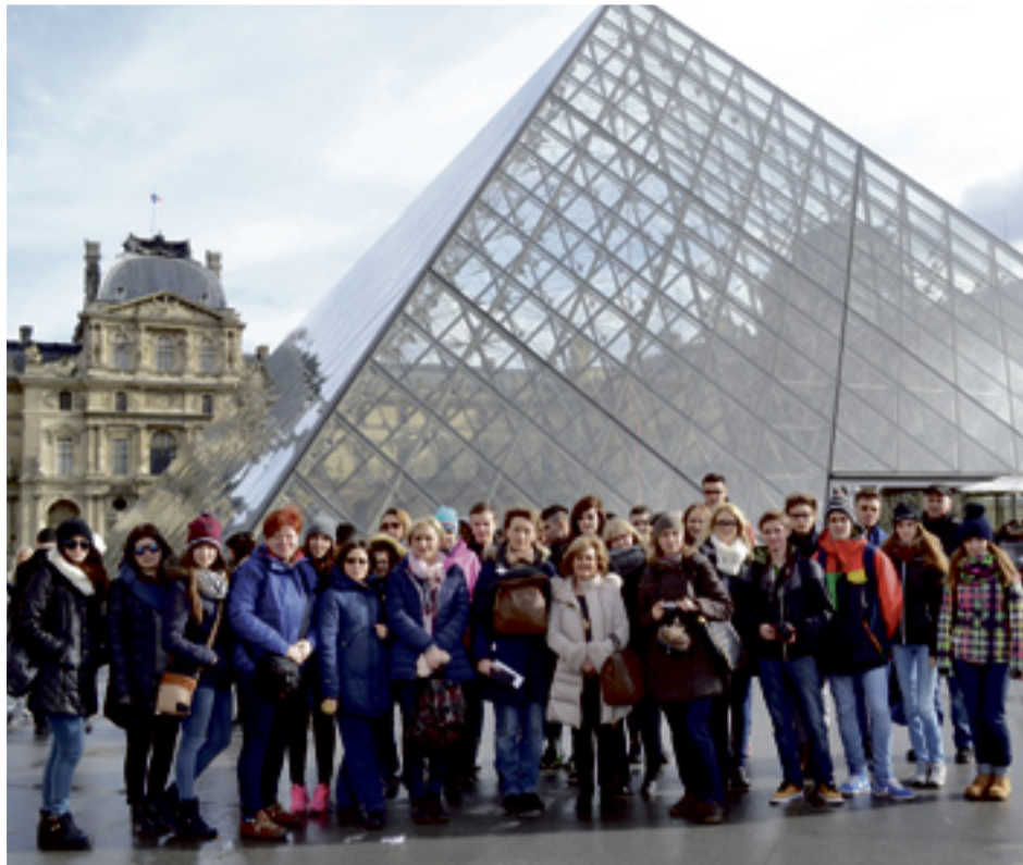
Tym razem uczniowie dwójki spędzili ferie w Paryżu.

Wtorek 24 lutego był ostatnim dniem naszego pobytu w Paryżu. Główną atrakcją tego dnia był wjazd na wieżę Eiffell oraz Łuk Triumfalny i spacer Polami Elizejskimi do Trocadero. Stamtąd udaliśmy się na