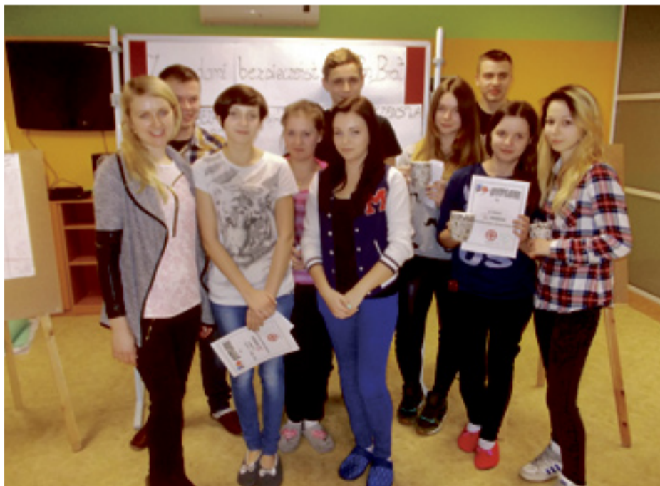
Młodzież spędza tu aktywnie swój wolny czas.

Z okazji 8 marca chłopcy przygotowali dla dziewcząt