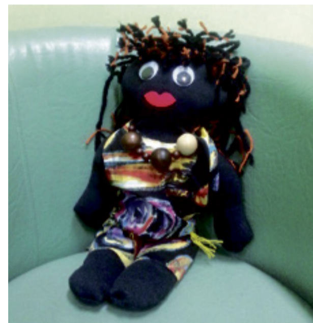
Takie lalki wykonali podopieczni ośrodka.