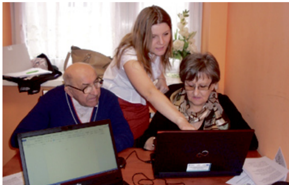
Pierwsze e-książki już są wypożyczone.

E-usługi Powiatowej Biblioteki Publicznej w Wągrowcu.