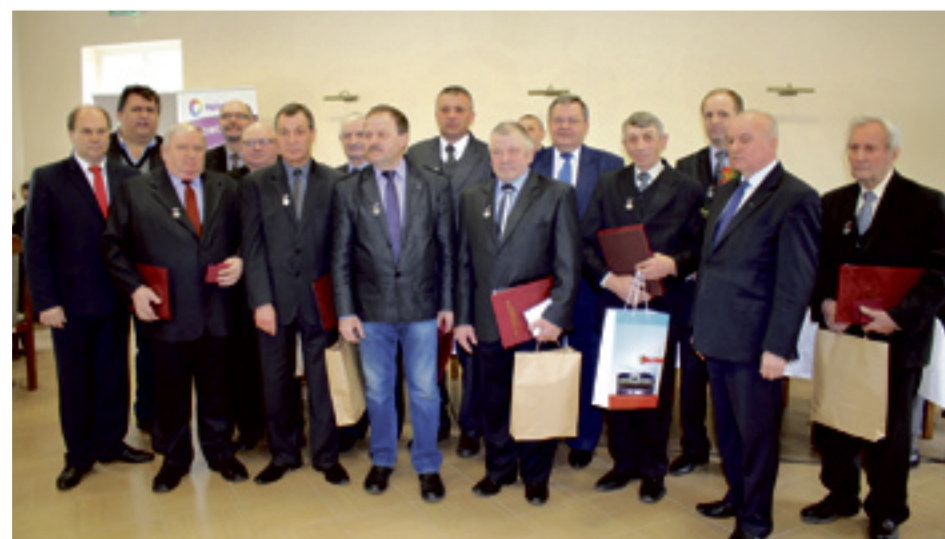
Praca dla rozwoju rolnictwa została doceniona.