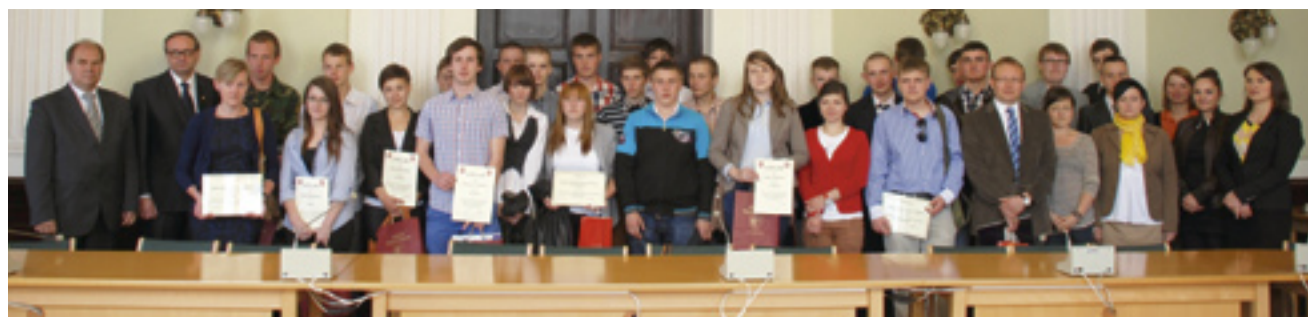
Starosta i Wicestarosta wraz z uczestnikami i laureatami.