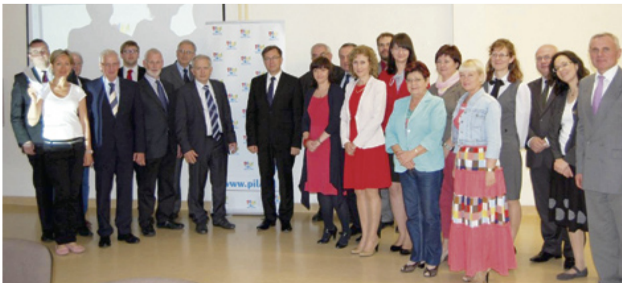
Uczestnicy Grupy Roboczej.