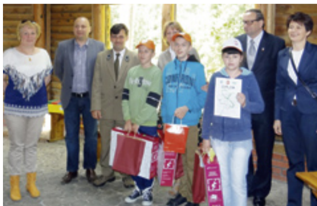
Organizatorzy i laureaci konkursu.

W rywalizacji udział wzięło 5 zespołów uczniowskich reprezentujących 5 powiatów województwa: ZSS w Gębicach, SOSW w Gnieźnie, ZSS w Kowanówku, SOSW w Pile i SOSW w Wągrowcu. Zespół uczniowski z SOSW w Wągrowcu reprezentowali uczniowie klas V-VI. Celem konkursu była popularyzacja wiedzy przyrodniczej i ekologicznej. Istotną jest też tutaj integracja dzieci ze specjalnymi potrzebami edukacyjnymi.