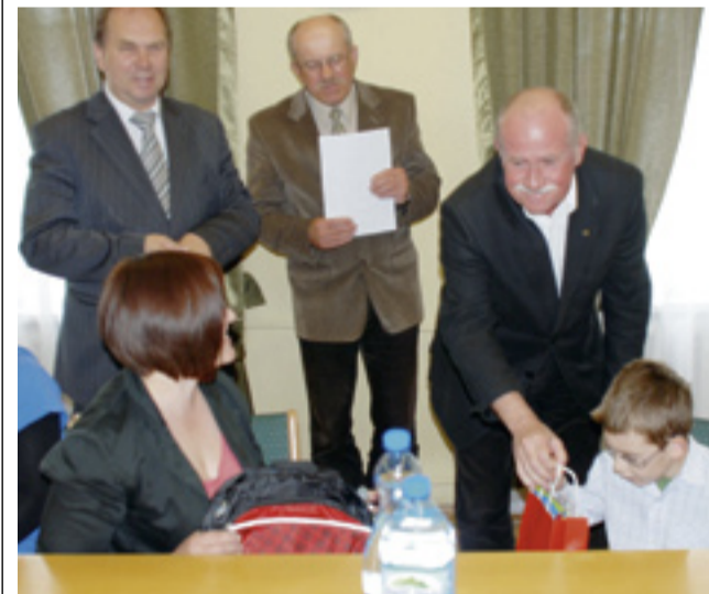
Laureaci otrzymują nagrody

27 maja w Starostwie Powiatowym odbyło się podsumowanie III Ogólnopolskiego Konkursu Plastycznego dla Dzieci „Bezpiecznie na Wsi – Powiedz Stop Upadkom!” Konkurs został ogłoszony przez Prezesa Kasy Rolniczego Ubezpieczenia Społecznego. Konkurs adresowany był do uczniów szkół podstawowych, a jego celem było promowanie zasad ochrony życia i zdrowia dzieci na terenach wiejskich, szerzenie wiedzy o bezpieczeństwie i higienie pracy rolniczej oraz kształtowanie pozytywnych zachowań dzieci w czasie ich zabaw w otoczeniu prac osób dorosłych w gospodarstwie rolnym.