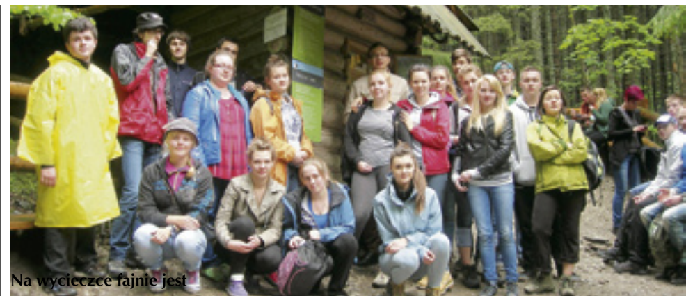
Na wycieczce fajnie jest