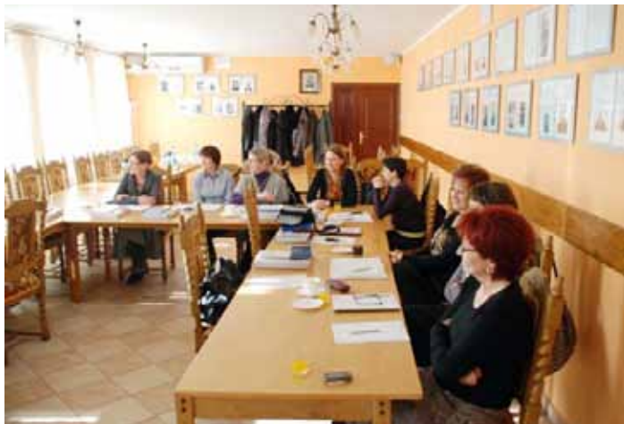
„Partnerstwo urzędów administracji samorządowej dla efektywniejszej realizacji usług publicznych” – szkolenie, Urząd Miasta i Gminy Gołańcz.

Głównym celem projektu jest podniesienie sprawności funkcjonowania 6 urzędów administracji samorządowej w aspekcie realizowanych usług publicznych oraz podwyższenie kompetencji 134 urzędników, w tym co najmniej 20% w wieku 45+ w okresie od 1 sierpnia 2010r. do 31 lipca 2012r.