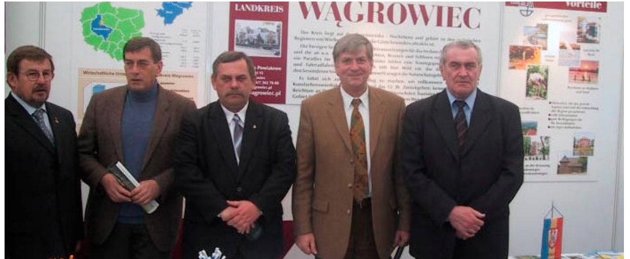
Delegacja z powiatu wągrowieckiego podczas Targów Blickpunkt w 2003 r.

Polska, która nie była członkiem Unii Europejskiej, posiadająca przestarzałą gospodarkę i społeczeństwo mniej zamożne, zyskała jednak sympatię bogatych, zachodnich państw europejskich. Nasze kontak-