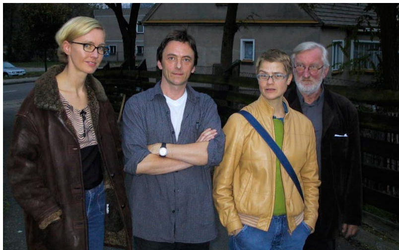
Artyści niemieccy z Bleckede w trakcie wystawy w Muzeum Regionalnym.

zwala przystąpić do dialogu ponad granicami państw, który wyostrza świadomość na to, że żyjemy w europejskim, międzynarodowym kontekście.