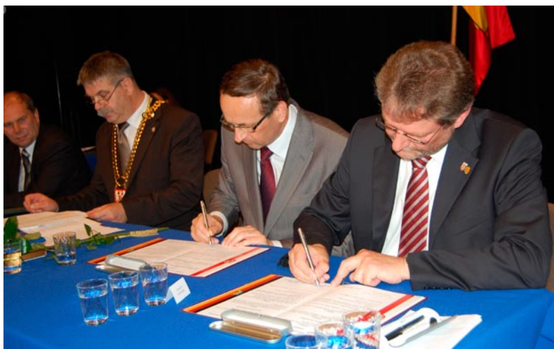
Starostowie dokonali symbolicznego odnowienia umowy partnerskiej z 24 lipca 1999r.

kadencji, a obecnie członek Zarządu Powiatu, wspierał partnerstwo na płaszczyźnie samorządowej. Uczest-