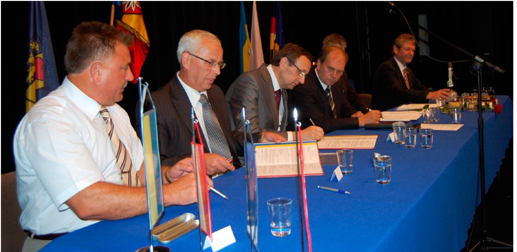
Podpisanie umowy partnerskiej pomiędzy Powiatem Wągrowieckim a Rejonem Czerwonoarmijskim.

Podjęta uchwała Rady Powiatu Wągrowieckiego w dniu 24 lipca br. upoważniła władze powiatu wągrowieckiego do podpisania stosownej umowy o współpracy z Rejonem Czerwonoarmijskim na Ukrainie.