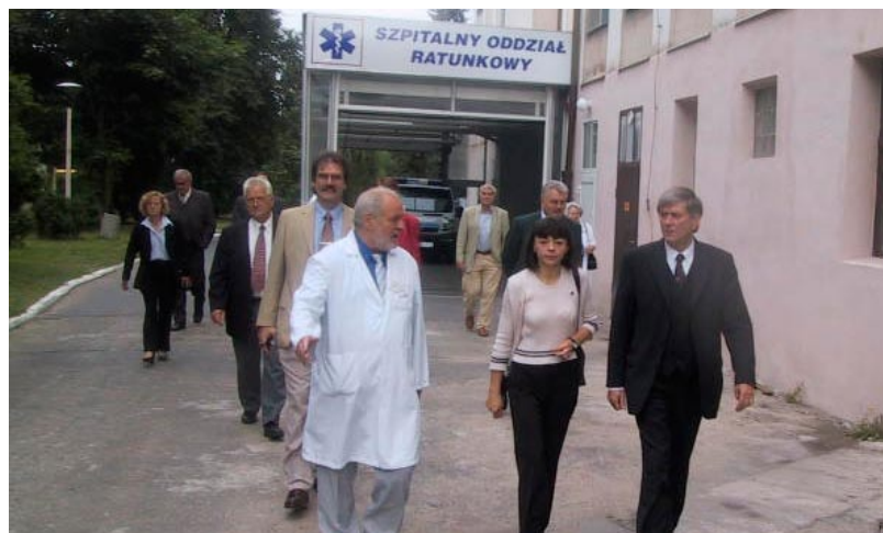
Wizyta delegacji Powiatu Lüneburg w Szpitalu Powiatowym w Wągrowcu.

Jednak realia polityczne, gospodarcze i kulturalne współczesnego świata wymagają spojrzenia sięgającego ponad granicami oraz często skierowanego ku historii, by móc wytłumaczyć je sobie oraz dzisiejszej młodzieży. Podczas warsztatów, seminariów oraz podczas zwiedzania uczestnicząca w nich młodzież ma wgląd w okres narodowego socjalizmu oraz drugiej wojny światowej, często dzięki pomocy świadków tego okresu oraz ówczesnych dokumentów. Podejmuje się przy tym próbę uwrażliwienia młodzieży na skutki wojny i przemocy. Mają przekonać się, że rasizm, wrogość wobec obcych i antysemityzm nie mają prawa bytu w otwartym, demokratycznie ukonstytuowanym społeczeństwie. Takie obozy dają im poczucie przynależności do europejskiej społeczności