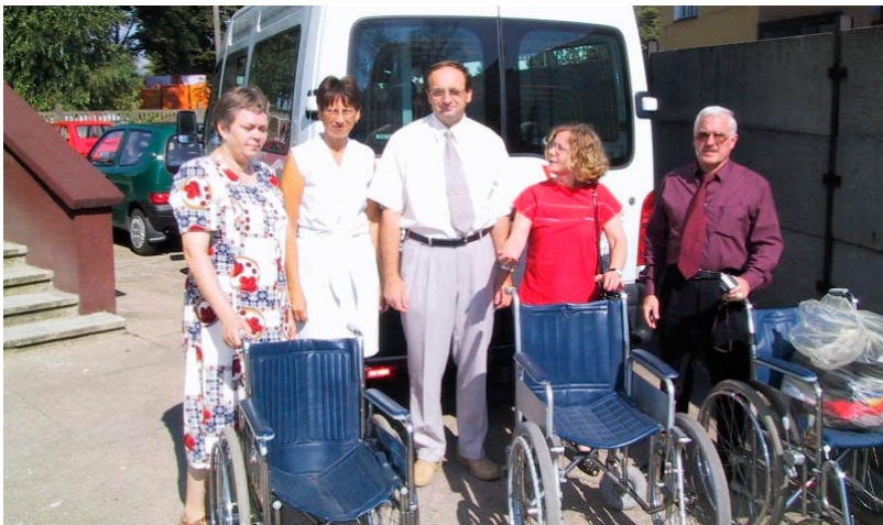
Nasz powiat otrzymał pomoc humanitarną w postaci m.in. sprzętu medycznego dla potrzeb Powiatowego Centrum Pomocy Rodzinie.

W dalszym ciągu powinniśmy mocno starać się, by zbliżali się do siebie przede wszystkim młodzi mieszkańcy naszych powiatów. Myślę, że młodzież umie uczyć się od siebie nawzajem. Świadczą o tym spotkania lat ubiegłych”.