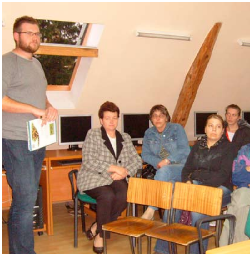
Zajęcia z rodzicami w Szkole Podstawowej w Siennie.

Aby nasza praca była skuteczna i efektywna, systematycznie staramy się podnosić swoje kwalifikacje poprzez uczestnictwo w różnorodnych formach doskonalenia i doksztalcania zawodowego. Od początku roku szkolnego poszerzaliśmy swoją wiedzę między innymi z takiej tematyki, jak: praca z dzieckiem z zespołem ADHD, otwarcie środowiska szkolnego na rzecz uczniów niepełnosprawnych, diagnozy uczniów dyslektycznych. Zdobytą wiedzę staramy się wykorzystywać w codziennej pracy diagnostycznej, terapeutycznej i profilaktycznej.