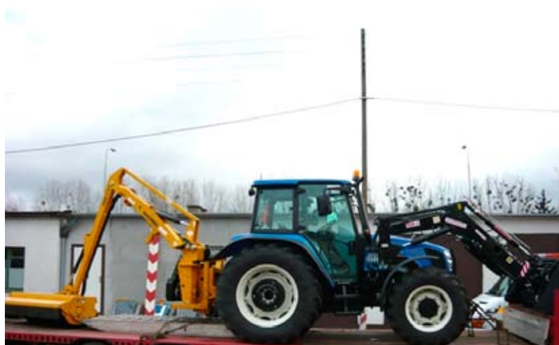
Nowy ciągnik z ramieniem hydraulicznym oraz ładowarką.

Poza wyżej wymienionymi zadaniami wynikającymi z obowiązków Powiatowego Zarządu Dróg w roku 2009 dokonano zakupu samochodu marki IVECO Daily 35C12 HPI, zagęszczarkę Weber CF2R oraz ciągnik marki New Holland T5060 wraz z ramieniem hydraulicznym z głowicą marki McConnell oraz z ładowarką. Powyższy ciągnik wraz z osprzętem będzie wykorzystywany do prac związanych z koszeniem traw, krzaków wzdłuż poboczy drogowych oraz innych prac związanych z bieżącym utrzymaniem dróg.