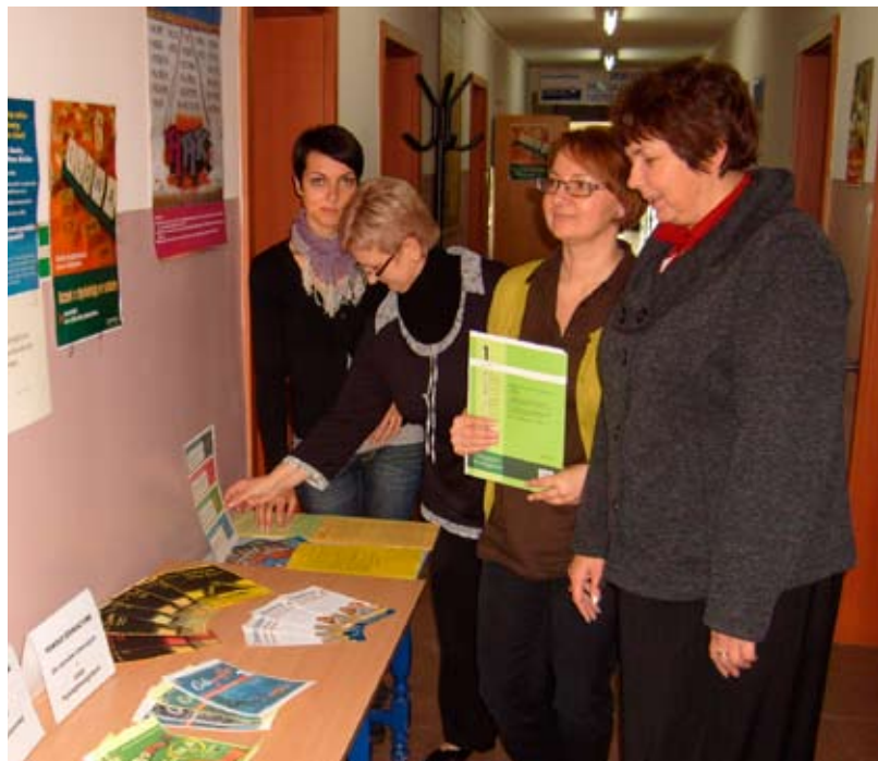
Dzień Bezpłatnych Konsultacji (dysleksja).