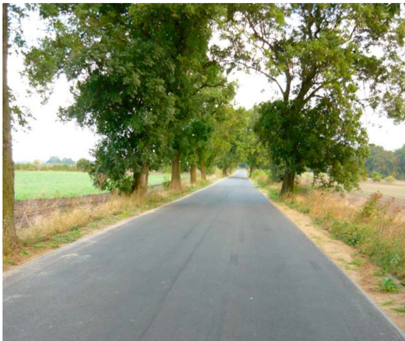
Droga Czesławice - Buszewo.