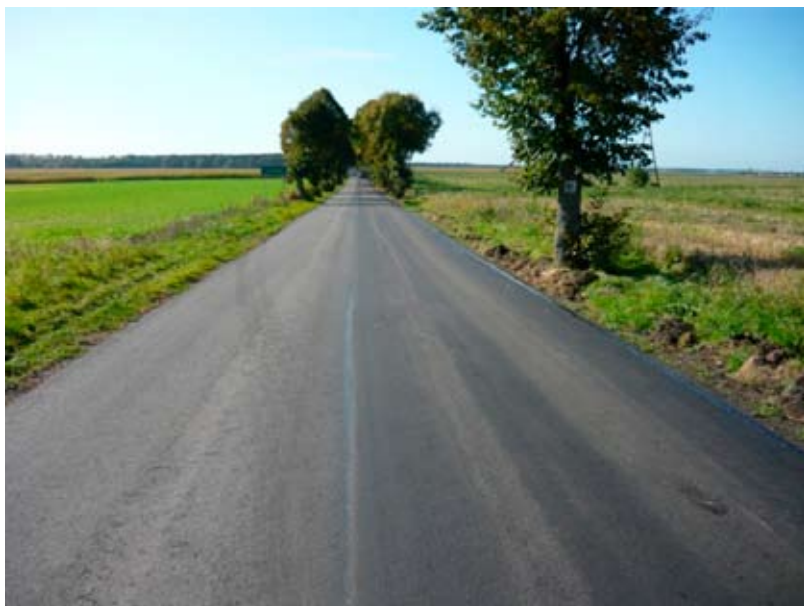
Droga Jabłkowo - Nowiny.

W dziedzinie remontów i przebudowy dróg Powiatowy Zarząd Dróg zakończył wszystkie zaplanowane zadania, które przeprowadzone były na drogach: Czesławice – Buszewo, Jabłkowo – Nowiny, Żelice, Żabiczyn, Ochodza. W ramach tych prac wykonane zostały nowe nawierzchnie bitumiczne o łącznej długości 6,528 km oraz 856,00 mb chodników, które poprawiają komfort i bezpieczeństwo użytkowników.