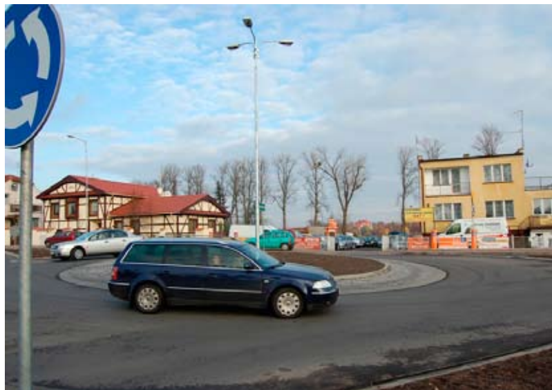
Rondo przy ul. Bartodziejskiej w Wągrowcu.

Poza wyżej wymienionymi zadaniami wynikającymi z obowiązków Powiatowego Zarządu Dróg w roku 2009 dokonano zakupu samochodu marki IVECO Daily 35C12 HPI, zagęszczarkę Weber CF2R oraz ciągnik marki New Holland T5060 wraz z ramieniem hydraulicznym z głowicą marki McConnell oraz z ładowarką. Powyższy ciągnik wraz z osprzętem będzie wykorzystywany do prac związanych z koszeniem traw, krzaków wzdłuż poboczy drogowych oraz innych prac związanych z bieżącym utrzymaniem dróg.