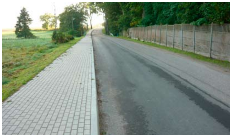
Chodnik w Żelichach.

Koniec roku jest najlepszym czasem na podsumowanie działalności Powiatowego Zarządu Dróg w roku 2009. W ramach współpracy z gminami