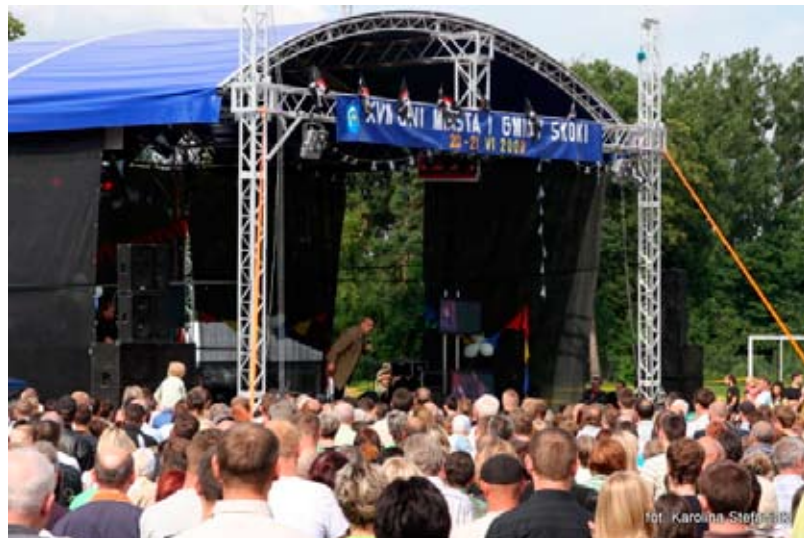
Dni Miasta i Gminy Skoki 2009.