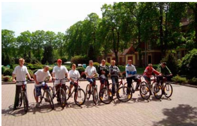
Uczestnicy projektu „Zainteresuj się bogactwem okolicy, w której mieszkasz” wyruszyli 9 maja na rajd rowerowy w celu sporządzenia dokumentacji zabytków i parków na terenie gminy Skoki.

Oprócz inwestycji zostały pozyskane środki na inwestycje w kapitał ludzki. Powiat wągrowiecki z pozyskanych środków zewnętrznych realizował również programy: „Przyszły absolwent bezkonkurencyjny na rynku pracy” – czyli zajęcia wyrównawcze, dodatkowe i praktyki zawodowe dla młodzieży szkół ponadgimnazjalnych kształcenia zawodowego z terenu Powiatu Wągrowieckiego oraz program pn. „Zainteresuj się bogactwem okolicy, w której mieszkasz”. Ten ostatni został w 100% sfinansowany ze środków Unii Europejskiej w ramach Europejskiego Funduszu Społecznego. Głównym celem projektu było podniesienie świadomości dzieci, młodzieży i dorosłych,